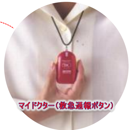
マイドクター(救急通報ボタン)