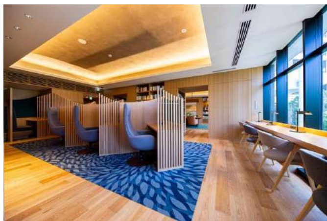
作業に集中できる「ワーキングスペース」