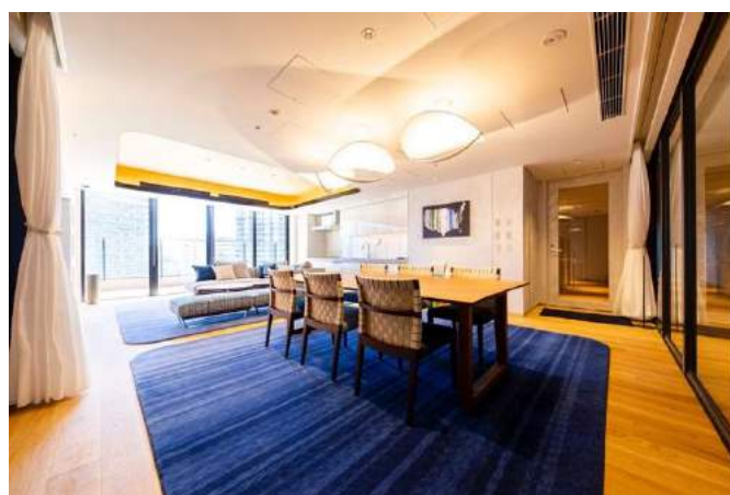
アットホームなパーティーを楽しめる「キッズパーティールーム」