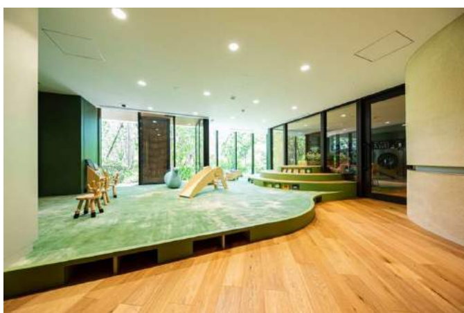
家事の隙間時間を活用できる「ランドリー＆プレイグラウンド」