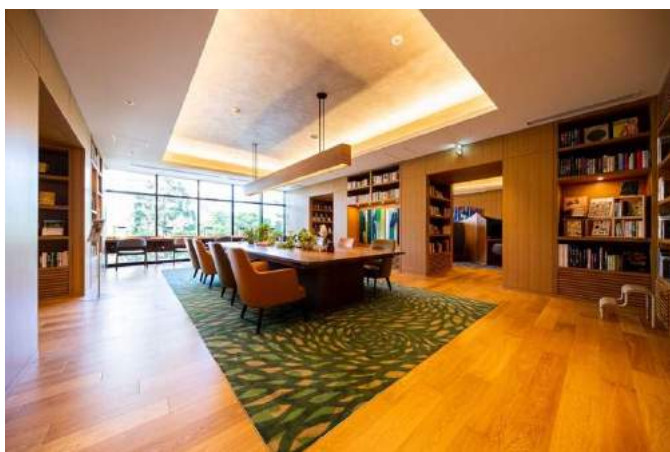
書籍に囲まれ、半個室も利用可能な「ブックコリドー」