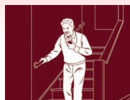
救急通報(オプション)