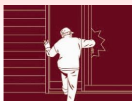
外出・在宅時の防犯