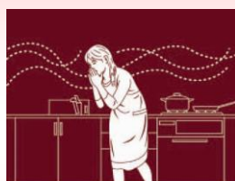
ガス漏れ監視(オプション)